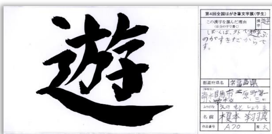
第4回展・小学低学年の部「大賞」